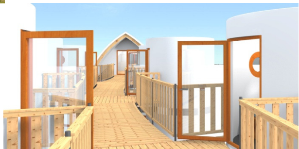
Rechts: Blick auf die obere Ebene des bboxx Hostels mit 40+2 Betten