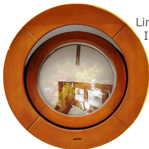
Links: Innenansicht eines bboxx Hostel-Zimmers.