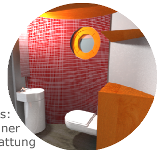
Rechts: Beispiel einer Bad/ WC-Ausstattung